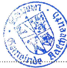
Otto Klaußner (Erster Bürgermeister)