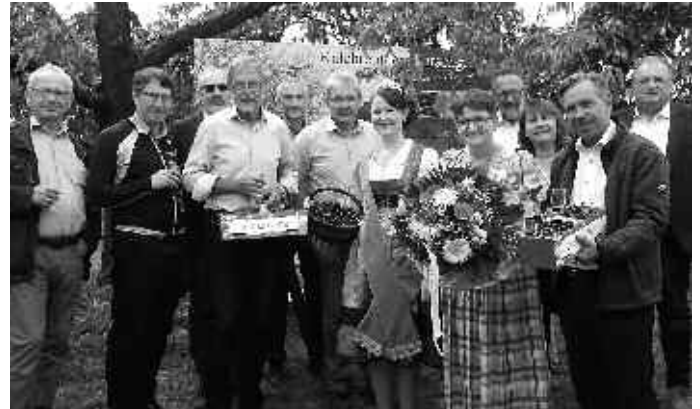
Foto von der Kirschkirchweih 2019

Aufgrund der geltenden Beschränkungen zur Corona-Pandemie müssen die Kirschenkirchweih am ersten Sonntag im Juli, sowie die Kirchweihen in Käswasser und Kalchreuth leider ausfallen.